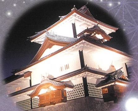
菱櫓・五十間長屋・橋爪門続櫓