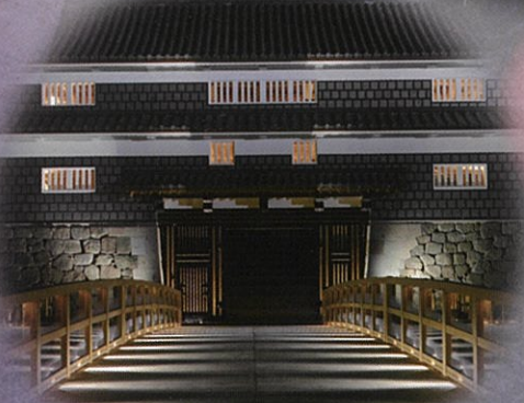
鼠多門・鼠多門橋